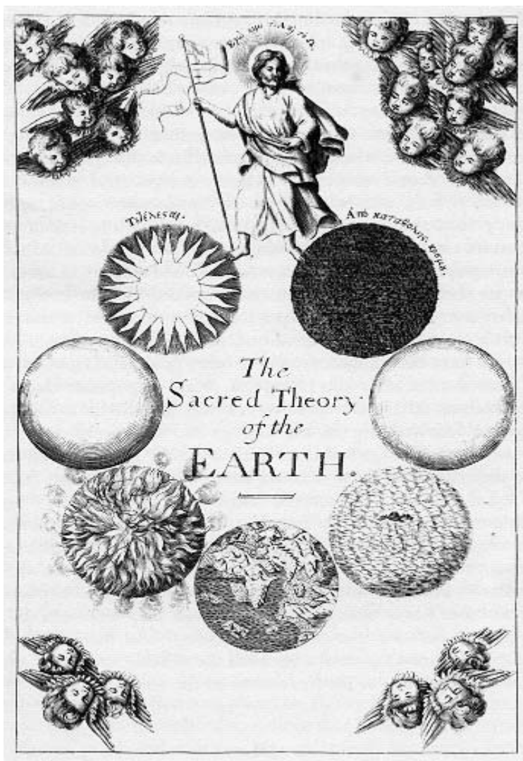
Figura 1. Portada de la obra de T. Burnet, 1684, Teoría Segrada de la Tierra (en Rudwick, 1972)